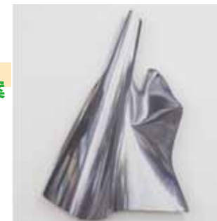
牧田 愛 ちばぎんひまわりギャラリー 2019

10号 (530×455mm) より大きい 作品、またはインスタレーション としての展示プランです。