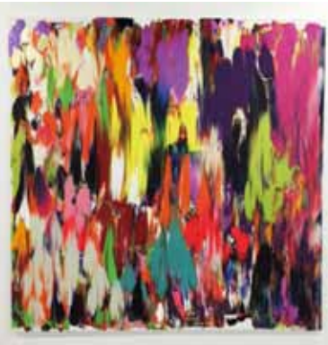
「彩りの壁」アクリル、カーボランダム、綿布 2273 x 2273 mm 2016 1,382,400 円 (税込)