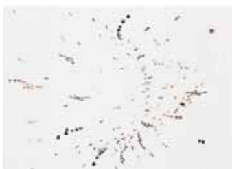
4. Flux (流動 / 流束) #7, 2019 紙に木炭、色鉛筆、罫子、ニス、23 x 32 cm ¥ 105,000