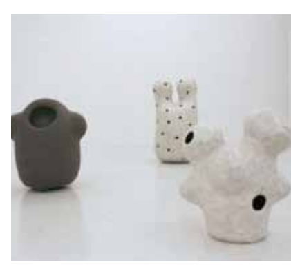
奥から「めたも 六」(陶)で670 x 500 x 750mm、 「めたも 七」(陶)で480 x 480 x 900mm 「めたも 八」(陶)で550 x 510 x 680mm 全て2019