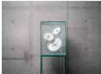
Landscape-time_006 2018年 ミクストメディア (SAP、水、時計、ガラス、電子機器) 30x30cm