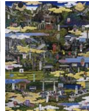
「山寺園」F5 O 合号 2017