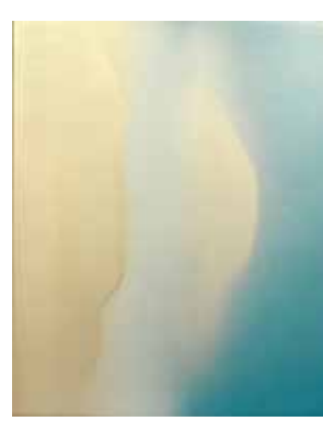
CRYSTALX アクリル、綿布、木枠 65.2 x 53 cm 1997