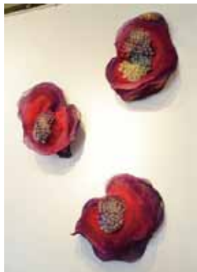
crawls (red) 2015 Silk organdy, Wire 70 x 50 x 50 cm / 3 pieces