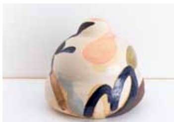
物腰 (2017-3) 陶 H31 x W31 x D25cm 2017