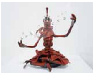
「2ガーディアンズ Soha-deva no. 1 俱生神・Man」 300mm×300mm×500mm 2015 エポキシ樹脂、 レジンキャスト、ミクストメディア