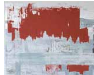
daytrip 2019 181.8cm x 227.3cm 岩絵具、アクリル、銀箔、金泥、膠、和紙