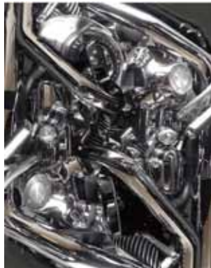
Gradation iv / 2017 / 116 x 91 cm / oil painting, canvas